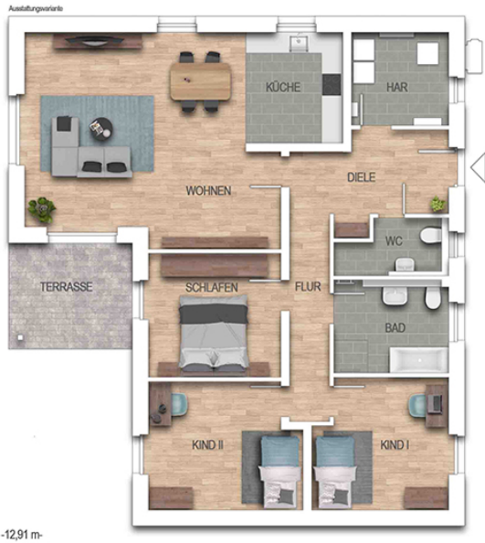
KFN Cumulus 67K Grundriss EG